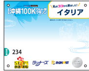
ナンバーカード(背中)