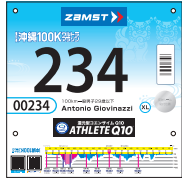
ナンバーカード(胸)