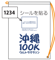
レストステーションバッグ W400mm×H600mm