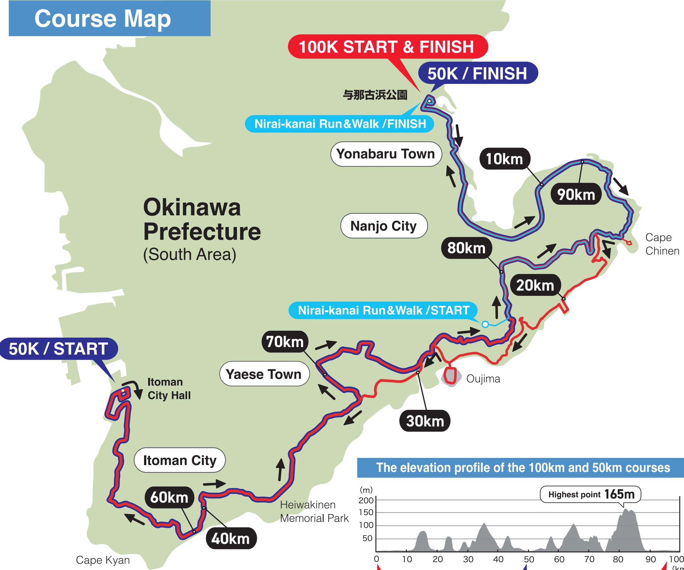
The elevation profile of the 100km and 50km courses